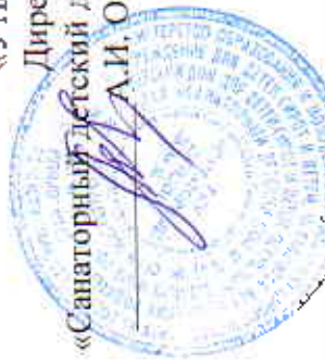
График работы руководителя краевого центра постинтернатного сопровождения выпускников государственных организаций для детей-сирот и детей, оставшихся без попечения родителей, «Сотрудничество»